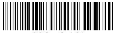
提示音 - 关