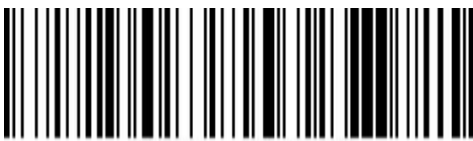
提示音 - 开启